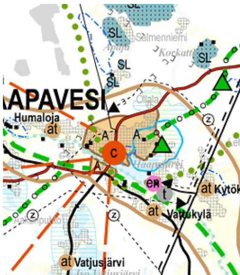
Ote Pohjois-Pohjanmaan maakuntakaavasta

Suunnittelualueella on voimassa Haapaveden keskustan osayleiskaava vuodelta 2011. Osayleiskaavassa alue on merkitty uudeksi asuinpientalojen alueeksi (AP), jonka maankäyttö ratkaistaan asemakaavalla ja virkistysalueeksi (V).